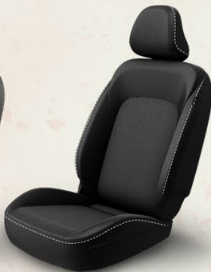
PIEL ECOLÓGICA TRANSPIRABLE

EXPERIMENTA UNA FORMA DE MANEJO MÁS DEPORTIVA, GRACIAS A SUS PALETAS DE CAMBIOS DETRÁS DEL VOLANTE PARA HACER REBASES O CAMBIOS NORMALES DE MARCHA, DE UNA FORMA MÁS RÁPIDA Y CÓMODA SIN PERDER PERFORMANCE.