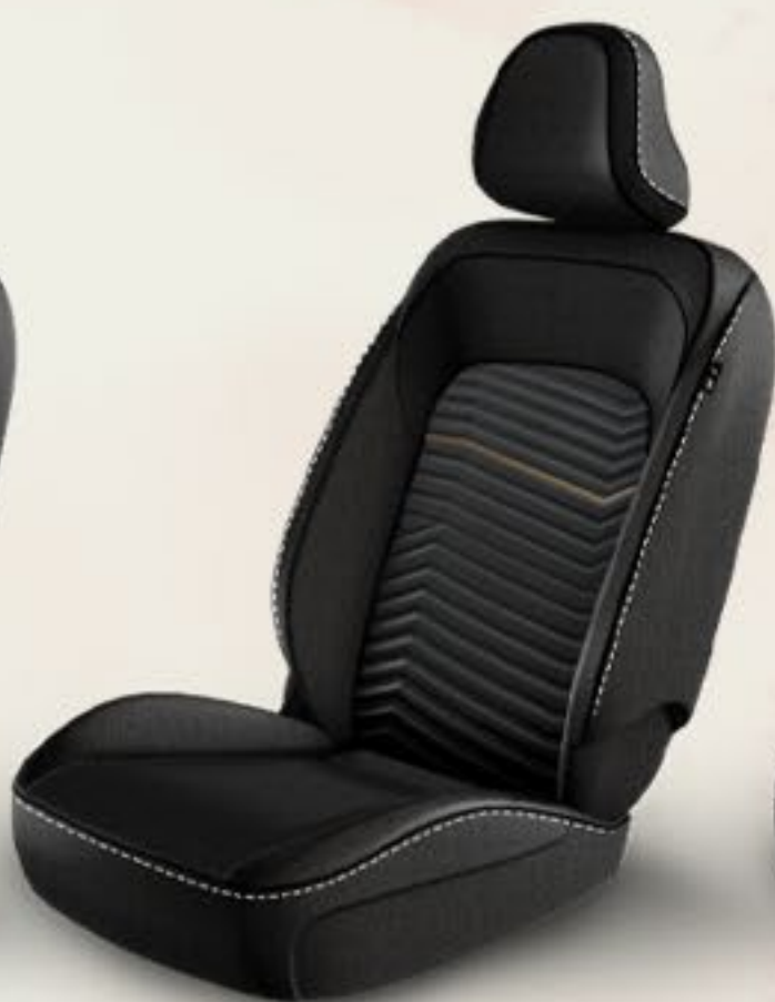
TELA PREMIUM GRABADA