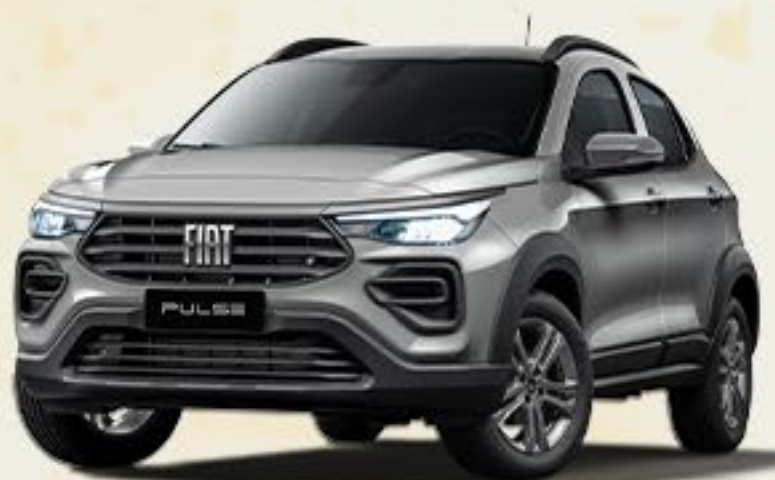
DRIVE PLUS CVT